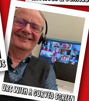
URS WITH A CURVED SCREEN