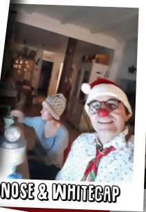
REDNOSE & WHITECAP