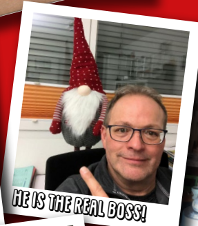
HE IS THE REAL BOSS!