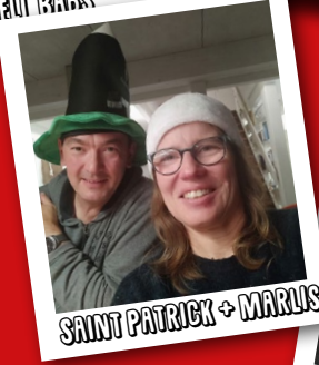
SAINT PATRICK + MARUS